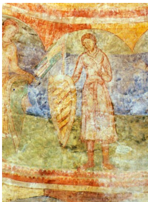
Obrázek 2: Z cyklu postav Přemyslovců ve znojemské rotundě sv. Kateřiny.

[ http://vesmir.cz/clanek.php3?CID=4003 ]