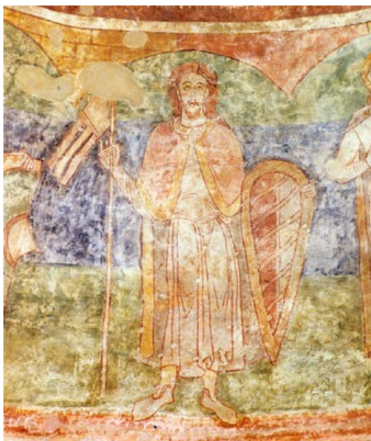
Obrázek 1: Z cyklu postav Přemyslovců ve znojemské rotundě sv. Kateřiny.