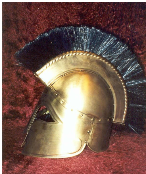
Obrázek 3: Replika řecké přilbice

[ http://vesmir.cz/clanek.php3?CID=4003 ]